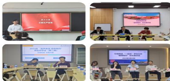
校领导深入学生社区开展育人活动40余场