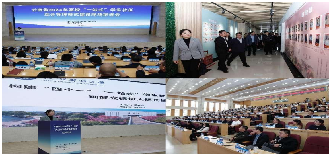
承办“云南省高校‘一站式’学生社区建设综合管理模式现场推进会”

学生社区建设综合管理模式现场推进会”，全省 90 所高校参会并现场观摩，学校作经验交流发言，为推动云南社区建设贡献了“昆医方案”。贵州医科大学等 10 余所高校先后来访交流。成果入选教育部 2025 年高校“一站式”学生社区风采展示优秀作品；省委组织部专题调研并高度评价社区党建育人工作；工作案例获云南省高校思政教育优秀工作案例一等奖。40 余项“一站式”学生社区建设研究成果被全国高校思想政治工作网、光明日报、云南网等刊发，并被学习强国推送，为全国高校社区育人提供了可复制、可推广的经验。